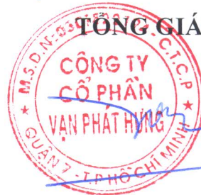
TRƯƠNG THÀNH NHÂN